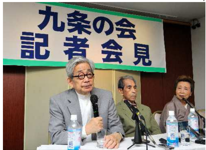
会見する 大江健三郎さん、奥平康弘さん、澤地久枝さん